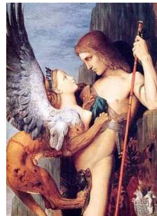
G. Moreau, Edipo e la Sfinge (part.)

Sette lezioni sulle differenze energetiche di genere