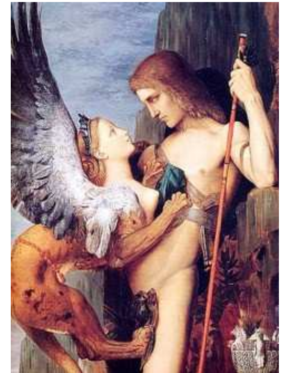
G. Moreau, Edipo e la Sfinge (part.)

Sette lezioni sulle differenze energetiche di genere